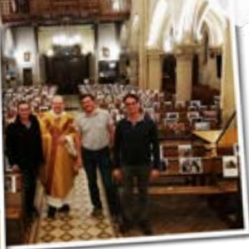
Messe de confirmation