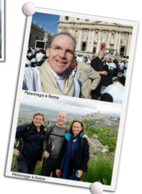
Pèlerinage à Rome