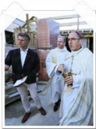
Cœur Saint-Louis, bénédiction de la première pierre